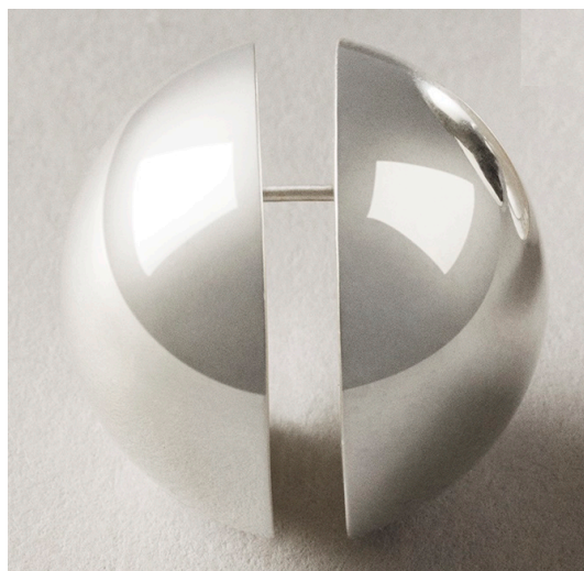
2 - 2

Produkt Nr 2: Örhänge Klasser (LOC 14): 11-01 Formgivare: Lisa Olsson Döbelnsgatan 55, 113 52 Stockholm, Sverige. (2) Innehavare: Nootka AB Döbelnsgatan 55, 113 52 Stockholm, Sverige. Ingivningsdag: 2023-12-15 Registrerad/kungjord: 2024-04-30 Giltig t.o.m.: 2028-12-15