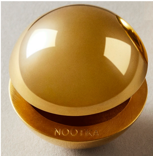
1 - 1