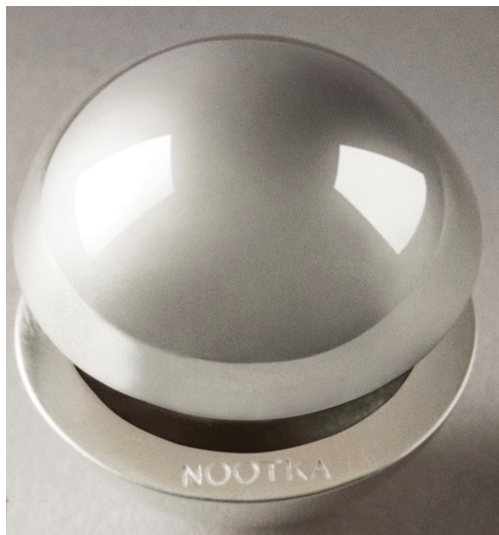
2 - 1